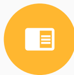
Cotizaciones / Órdenes