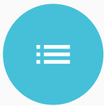
Lista de precios