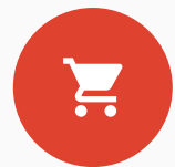
Punto de venta